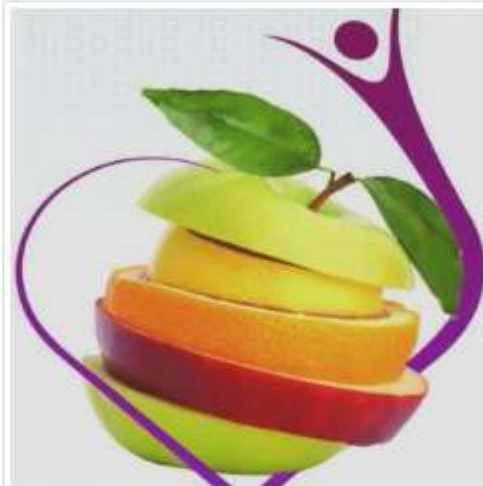
کانال گلستان سلامت

دانستنی های جالب و علمی در حوزه سلامت و زیبایی